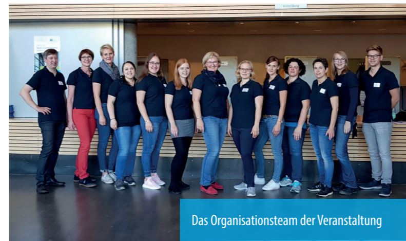
Das Organisationsteam der Veranstaltung